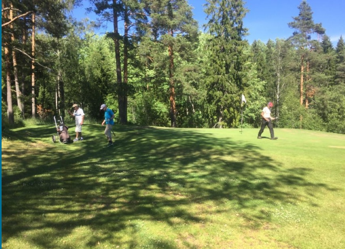
Viheriöholkitus 25.6. Lampila Golfin koneella. Pelikierros talkoiden päätteeksi

KAAKON GOLF in uusi tai vanha jäsen! Onko tasoituksesi välillä 50 – 54 ? * JUURI SINUT * Haluamme kutsua golfkentälle! Tarjoamme Sinulle kolme ILMAISTA pelikertaa ja hankimme sinulle myös pelikaverin - jos vain sellaista tarvitset..! Vain soitto ensin, puh. 050 3 888 200